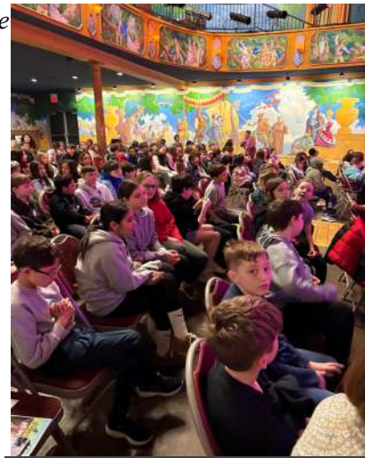
Our March field trip to Growing Stage Theater to see a play about Ben Franklin.

En matemáticas, hemos terminado nuestro libro con un estudio sobre volumen, área de superficie y estadística. El próximo mes repasaremos el examen NJSLA, que seguro que los alumnos de sexto grado esperan con ilusión (¡estamos aprendiendo sobre ironía y sarcasmo en sexto!), antes de pasar a la educación financiera.